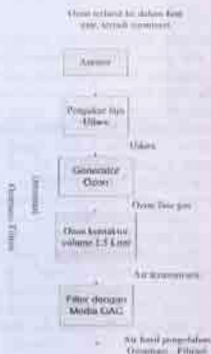
Gambar 2. Skema Penelitian Ozonisasi dan BAC