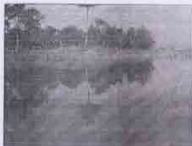
Gambar 1. Lokasi Pengambilan Sampel

Peralatan yang digunakan pada penelitian ini adalah alat untuk proses ozonisasi berupa aerator, pengukur laju aliran udara, generator ozon, dan ozon kontaktor dengan volume 1,5 liter, serta dilengkapi dengan katup untuk pengambilan sampel. Proses filtrasi dilakukan pada filter sederhana dari pipa PVC berdiameter 2 inci dan tinggi 32 cm. Ozon Filter dilengkapi dengan katup untuk pengambilan sampel dan system under drain . Proses filtrasi dilakukan dengan dua variasi. Pada variasi pertama filter di isi media GAC setebal 25 cm, sedangkan variasi tebal media ke dua yaitu GAC setebal 15 cm. Karakteristik GAC yang digunakan adalah Ukuran Efektif (ES) 16 mm, luas permukaan : 900 \text{ m}^2/\text{g} , densitas 0,05 \text{ gr/ml} , dan koefisien keseragaman (UC) 1,8. Metode yang digunakan untuk pengukuran konsentrasi sisa ozon, yaitu metode Indigo Colorimetric (4500-O3-B).